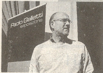
Il pittore Paolo Galletti

CAPANNORI. Nella suggestiva cornice della ventiduesima rassegna delle Antiche Camelie della Lucchesia, che si tiene nelle località di Sant'Andrea e Pieve di Compito nel territorio comunale di Capannori, sarà possibile ammirare le venti tele del pittore contemporaneo Paolo Galletti.